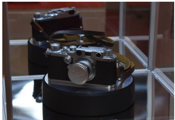
6 映画「北の桜守」江蓮てつ（吉永小百合）使用カメラ (北の桜守パーク [稚内市映画北の桜守資料展示施設] 展示)