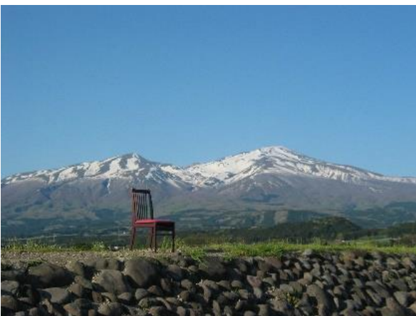
5 映画「おくりびと」 鳥海山