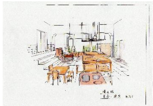
4 映画「ラストレシピ」デザイン画「官舎 厨房 窓向け」 (作画：部谷京子美術デザイナー)