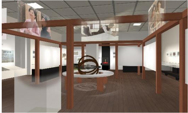
2 企画展示室イメージ