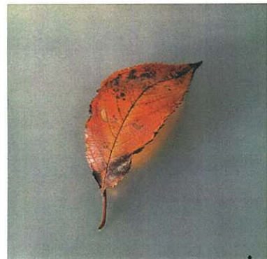
どんなにねだんがたかくとも、 うつくしくないものはある。 たとえただでも、 うつくしいものはある。