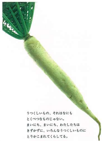
うつくしいもの、それはなにも とくべつなものじゃない。 まいにち、まいにち、わたしたちは きずかずに、いろんなうつくしいものに とりかこまれてくらしてる。