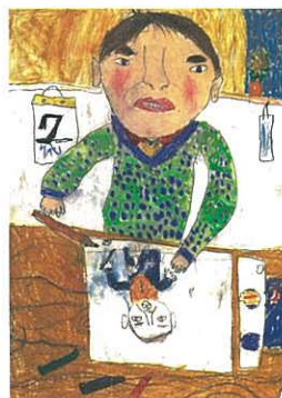
うつくしさをはかる、 ものさしのようなものはあるのだろうか？ あるひとつのものを、 ほかのもうひとつのものよりうつくしいと、 どうやってきめることができるのだろうか？

〒930-0095 富山県富山市舟橋南町2-22 高志の国文学館「うつくしい!」係 電話 076-431-5492 (9時30分~18時00分、火曜休館)