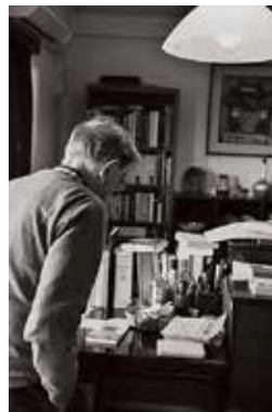
西ヶ原の書斎で