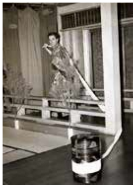
「ドナルド・キーン氏送別狂言会」で 狂言「千鳥」の太郎冠者を演じる 1956年9月13日 東京・喜多能楽堂で