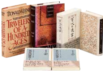
『百代の过客』『続 百代の过客』 及びその翻訳