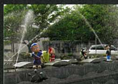
忍者ハットリくんカラクリ時計