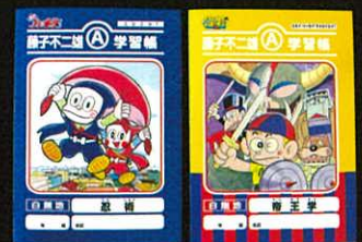
学習帳 〈忍者ハットリくん・怪物くん〉