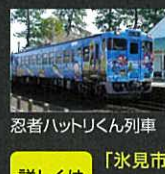
忍者ハットリくん列車