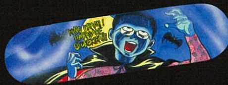
スケートボード 〈魔太郎がくる!!〉