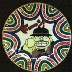
丸谷焼 豆皿 〈笑ゥせえるすまん〉