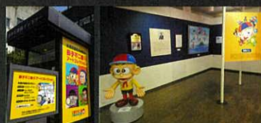
氷見市潮風ギャラリー「藤子不二雄 Ⓐ アートコレクション」