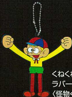
くねくね ラバーストラップ 〈怪物くん〉