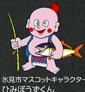
氷見市マスコットキャラクター ひみぼうずくん

詳しくは「氷見市藤子不二雄 Ⓐ まんがワールド」の公式サイトへ! http://himi-manga.jp/