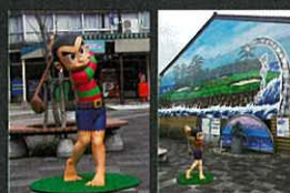
プロゴルファー猿 ポケットパーク