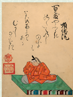
清原雪信画「百人一首画帖」 (嵯峨嵐山文華館蔵)