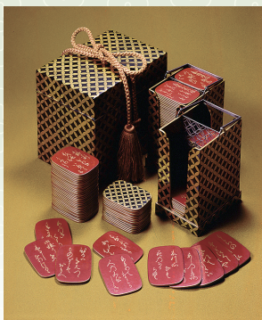
「時絵百人一首歌かるた」 (滴翠美術館蔵)