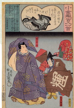
三代歌川豊国画 「小倉擬百人一首」(個人蔵)

本展では、これまでの研究成果をふまえて、時代を超えて読み継がれる百人一首の魅力と文化的な広がりについて、美術館、図書館、個人所蔵の貴重なコレクションを通じてご紹介いたします。歌仙絵、かるた、浮世絵など、百人一首の多彩な世界をお楽しみいただくとともに、日本人の繊細な自然感覚や美意識の源流である美しい和歌の世界をあらためてご鑑賞ください。