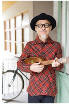
2 長谷川義史 肖像 ©長谷川義史