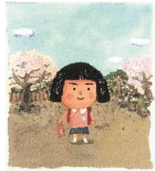
3 原画「しげちゃん」 ©長谷川義史