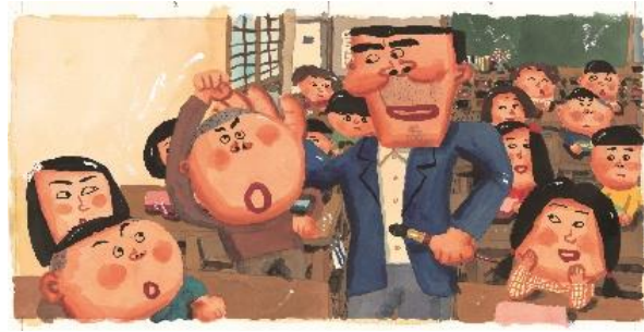
5 原画「おおにしせんせい」 ©長谷川義史