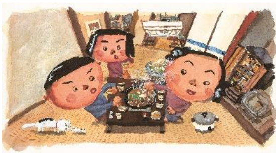
4 原画「おかあちゃんがつくったる」 ©長谷川義史